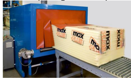
Anliegende Folie kompakt geschrumpft