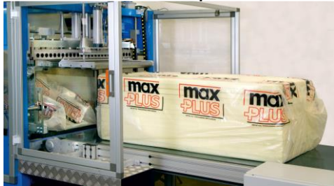
Enge Folientüte mit Formschulter ohne Schrumpftunnel